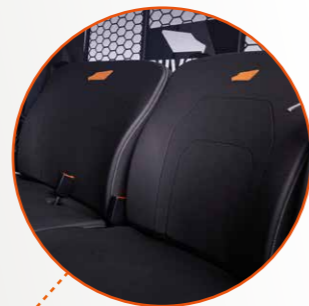
Banqueta corrida ajustable

Terrain DX4, un potente y robusto vehículo 4x4 diésel con gran capacidad de almacenaje y carga. Una máquina de trabajo diseñada para soportar las condiciones más duras.